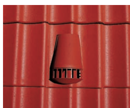
ciemnoczerwony kolor specjalny